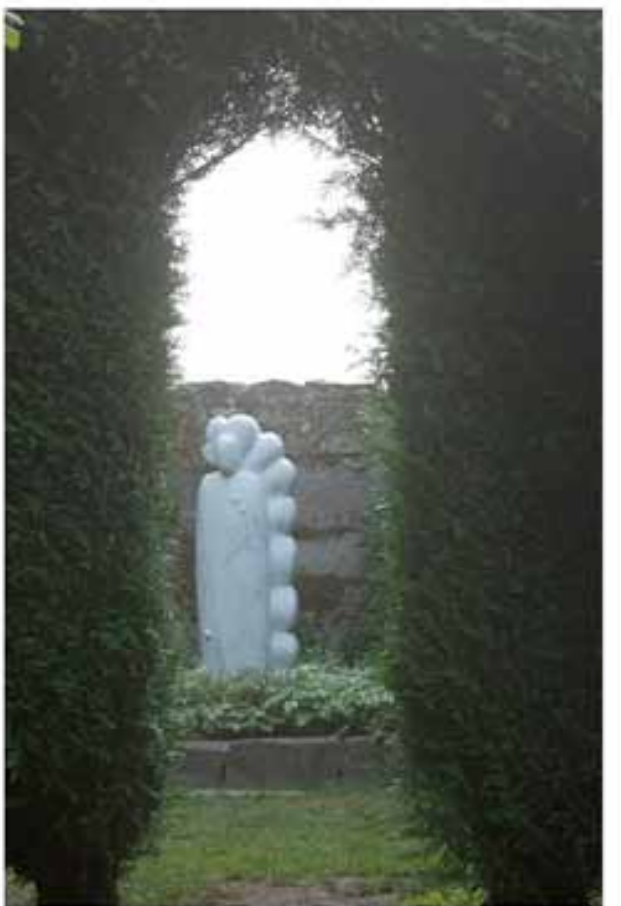
La Ballue, son théâtre de verdure, ses allées mystérieuses, le temple de Diane...