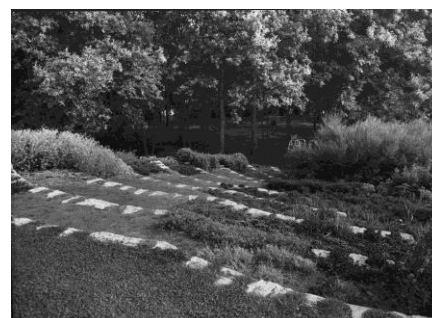
Le théâtre de verdure au début des années 1960.