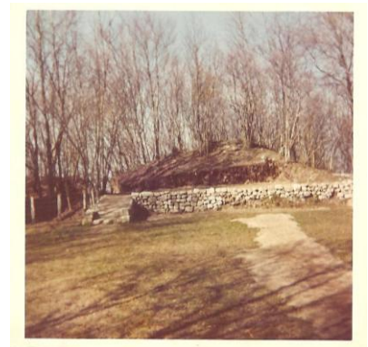
Construction du théâtre de verdure autour de 1975, Archives de la Présidente de l'Association des Amis du patrimoine d'Uchon.