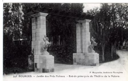
Entrée du théâtre de verdure