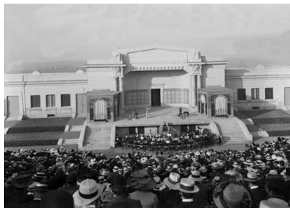
Le théâtre de verdure au début du XIX e siècle