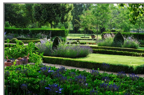
Les jardins du Chaigne, Charente.

Le 15 avril 2012 aura lieu la première édition de la journée « les Plantes en Fête ». Des exposants pépiniéristes présenteront des plantes rares ou insolites adaptées à la biodiversité du département de la Charente. Pour plus d'informations consultez le site : http://jardinsduchaigne.com/ .