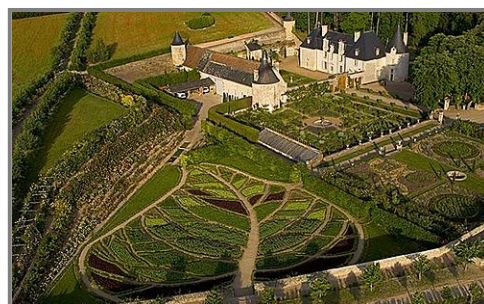
Les jardins de la Chatonnière, Azay-le-Rideau, Indre-et-Loire.

● Le théâtre de verdure s'achève à la Chatonnière : sa construction devrait être terminée dans le courant du printemps, et le théâtre pourra désormais accueillir dans de meilleures conditions les spectacles qui animent déjà depuis plusieurs années les merveilleux jardins de ce domaine.