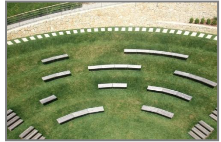
Théâtre de verdure de la ville de Grâne, Drôme.