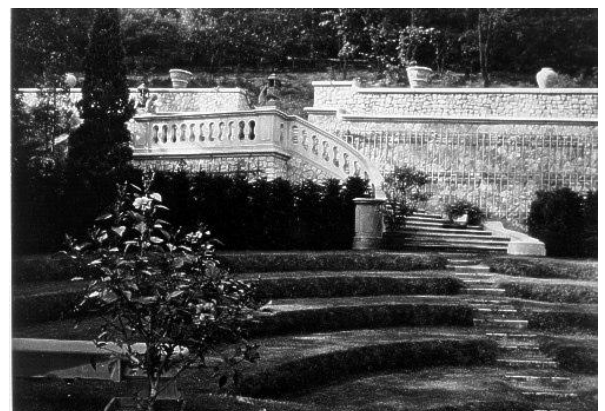
Escalier menant au théâtre de verdure