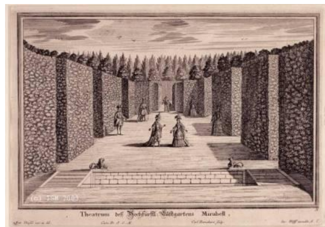
Théâtre de verdure de Mirabell, dessin de Matthias Diesel, gravé par Carl Remshart, publié par Jeremias Wolff Augsburg.