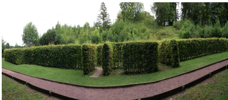
Le labyrinthe végétal