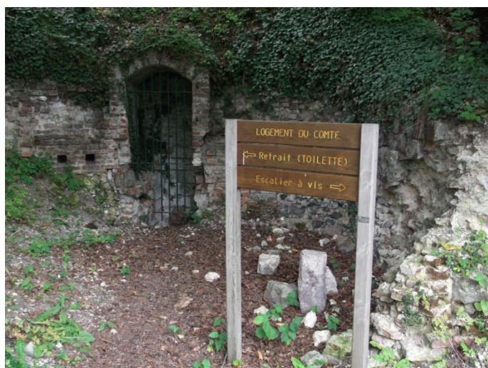
Les restes de la tour du comte