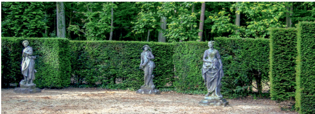
Le théâtre du château de Mivoisin dans le Loiret, créé par Russel Page à la demande de Marcel Boussac

Les théâtres de verdure constituent un patrimoine vert original, utilisant largement l'art topiaire. Déjà plaisants lorsqu'ils sont vides, ils assurent au public une expérience inédite lorsqu'ils mêlent l'art de la scène à celui du paysage. Une jeune association, dénommée Resthever, accompagne aujourd'hui leur renouveau.