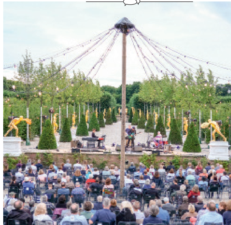
CI-DESSUS : Le théâtre de verdure des Jardins royaux d'Herrenhausen en Allemagne, de style baroque, accueille de nombreuses représentations, pièces et comédies musicales

En juin 2021, le château de La Ballue a accueilli une manifestation intitulée « Les Arts au jardin : art topiaire, théâtre de verdure et spectacle vivant ». Ces deux journées ont été rythmées par différentes animations – spectacles lyriques, chorégraphiques, conférences – qui ont illustré, entre autres, les liens forts unissant l'univers du spectacle et celui du jardin. Cette année, les 19 et 20 août, le théâtre a accueilli Contes du temps passé : trois