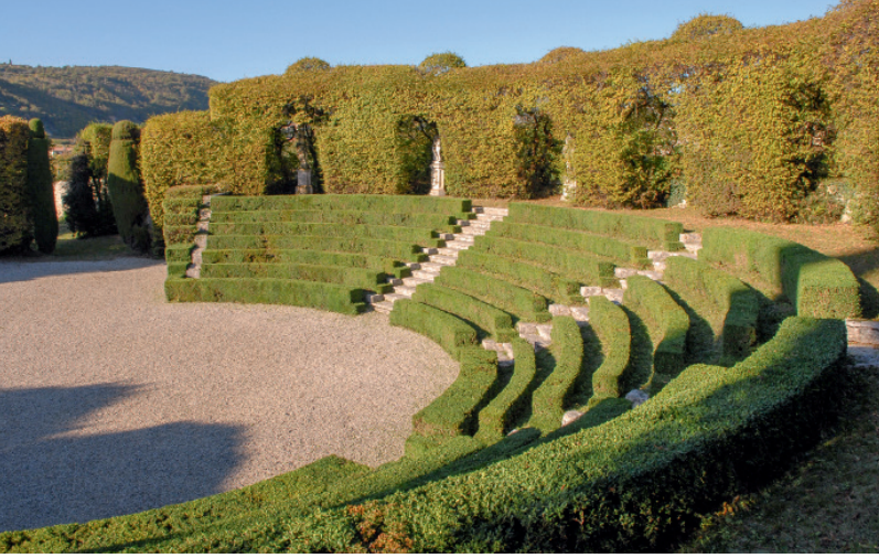
Le théâtre de verdure de la Villa Rizzardi est le plus grand d'Italie. Ses contours sont dessinés par des murs de verdure

Aux XIX e et XX e siècles, l'art topiaire a pu s'estomper, analyse Marie-Caroline Thuillier, voire disparaître de certains modèles au profit de variantes plus minérales ou sylvestres, mais les interactions n'ont jamais cessé entre ces deux univers.