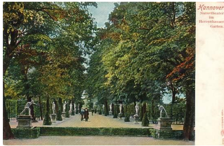
Le théâtre de verdure en 1930